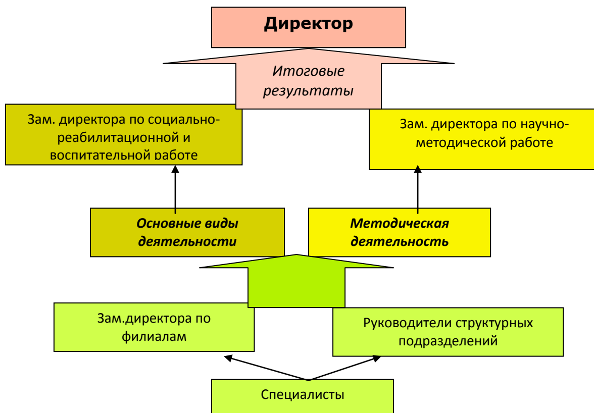
Система предоставления отчетной документации в ГКУПК СОИ СРЦН г.Перми

Для контроля реабилитационного процесса и деятельности Учреждения, аналитического обобщения результатов и с целью повышения качества оказания услуг в Учреждении разработана система отчетов.